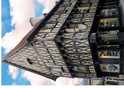
La maison médiévale des Trois Flûtes à Bourges

Alors que les faubourgs des villes connaissent une nouvelle croissance, de véritables lotissements urbains voient le jour. Les jardins disparaissent progressivement, le bâti devient de plus en plus dense et les demeures remarquables décorées selon les codes de la Renaissance se distinguent avec leur architecture de pierres ou de briques.