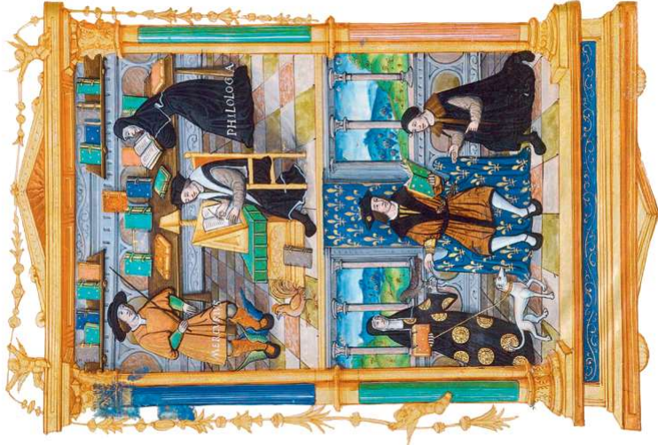
Sur la partie haute de cette enluminure se trouve une bibliothèque de la Renaissance.