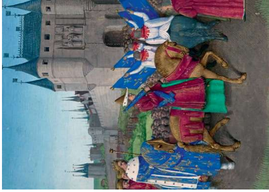
Entrée de Charles V à Paris, tirée des Grandes Chroniques de France , enluminées par Jean Fouquet, vers 1455-1460. Document conservé à la BnF.

Depuis le milieu du XIV e siècle, se développe en effet une cérémonie singulière lorsque le souverain entre pour la première fois dans une de ses « bonnes villes ». Là, les bourgeois l'accueillent avec toute la solennité nécessaire pour célébrer l'autorité de celui qui, souvent, leur a concédé d'importants droits et privilèges. La cérémonie est très ritualisée : le roi est accueilli sous un dais tenu par